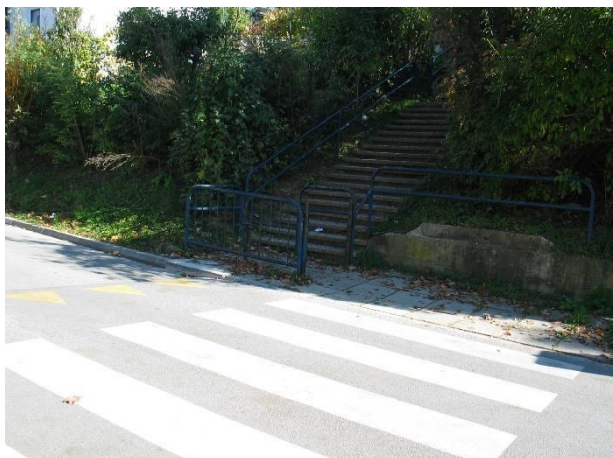
Zavarovan prehod čez cesto s poti po stopnicah.