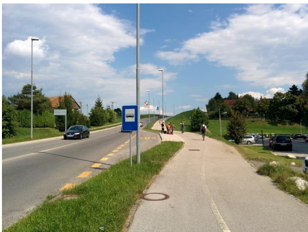
Postajališče Nova vas Lidl