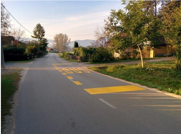
Postajališče Lahovna (pri hišni št. Dobrova 27)