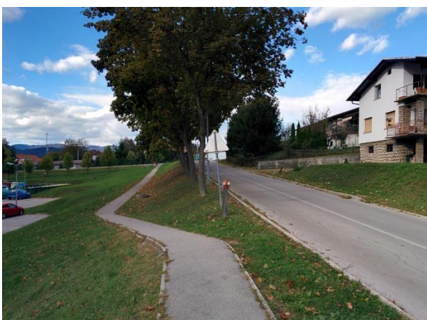
Otroci naj hodijo po pločniku ob cesti!