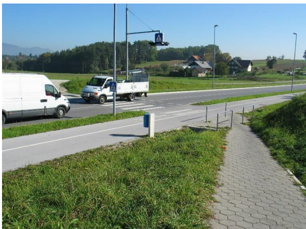
Prehod čez obvoznico s Hudinje.