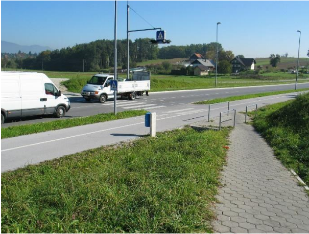
Prehod čez obvoznico s Hudinje.