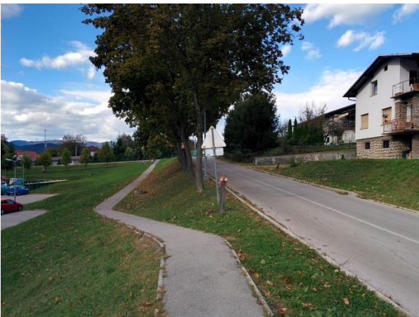
Otroci naj hodijo po pločniku ob cesti!